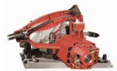
Kreissäge. Auch für hohe Drehzahlen garantieren Schunk-Kohlebürsten lange Lebensdauer

Bohrmaschinen und Bohrhämmer. Gefragt sind lange Kohlebürstenstandzeiten und Servicefreundlichkeit